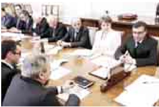
каждом дожде смывает мосты или дороги, нельзя считать приемлемым», — сказал Глава КБР.

Принятыми экстренными мерами нарушения работ объектов жизнеобеспечения не допущено. Исключение составляют с. Шордаково и районцент Залукокаже, где до конца сегодняшнего дня будут завершены все аварийно-восстановительные работы. Планомерно проведена очистка территории частных домовладений от наносов и мусора, оказывается помощь населению по откату воды из затопленных подвалов. Восстановлено движение по автомобильному мосту в с. Октябрьское, одновременно идёт монтаж временного моста в с. Шордаково. Проведена ревизия электрических и газовых сетей. Среди населения погибших и пострадавших нет. Для нормализации обстановки создана группировка сил общей численностью 258