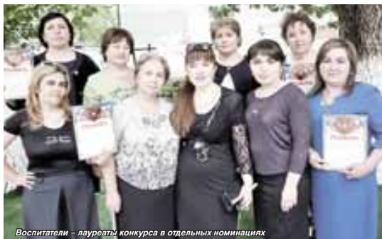
Воспитатели – лауреаты конкурса в отдельных номинациях

Двор первого дошкольного отделения тырнмауской гимназии №5 наполнен детскими голосами. Малышам есть где поиграть, порезвиться, особенно этим летом. За последнее время появилось дополнительное игровое и спортивное оборудование, раскрашенное в яркие цвета, эстетические уголки, зелёные насаждения. Все привлекает внимание и радует глаз.