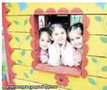
Воспитанники средней группы

Двор первого дошкольного отделения тырнмауской гимназии №5 наполнен детскими голосами. Малышам есть где поиграть, порезвиться, особенно этим летом. За последнее время появилось дополнительное игровое и спортивное оборудование, раскрашенное в яркие цвета, эстетические уголки, зелёные насаждения. Все привлекает внимание и радует глаз.