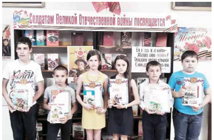
Материалы разворота подготовила Ирина БОГАЧЁВА

«Мы благодарны юным авторам за участие в конкурсе, память о героических защитниках Отечества, взрослое осознание ответственности за нашу страну, – говорят члены конкурсного жюри. – Особая признательность педагогам и родителям за понимание важности и актуальности темы. От всей души желаем ребятам дальнейших творческих успехов».