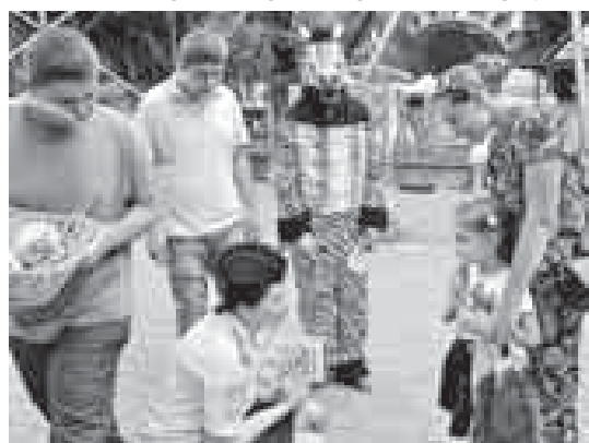
Материалы рубрики подготовила Ирина ШКЕЖЕВА

Центральная аллея Атажукинского сада ежедневно собирает сотни взрослых и детей из столицы и районов Кабардино-Балкарии, а также гостей республики.