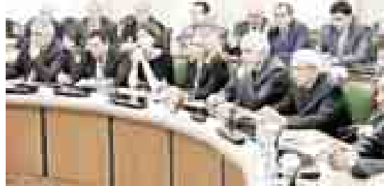
Соб. инф.

дательной и исполнительной власти республики, правоохранительных структур, глав местных администраций, общественных и правозащитных организаций. Открывая совещание, Ю.А. Кокков сказал о том, что в сфере заботы и внимания института уполномоченного ходят дома ребёнка, детские больницы, детские дома и