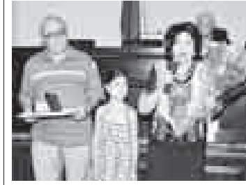
Медаль «За любовь и верность» учреждена в 2008 году организационным комитетом по проведению Дня семьи, любви и верности

Вестность среди сограждан крепостью семейных устоев, основанных на взаимной любви и верности, а также добывшихся благополучия, обеспеченного совместным трудом, воспитавших детей достойными гражданами общества.