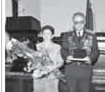
Медаль «За любовь и верность» учреждена в 2008 году организационным комитетом по проведению Дня семьи, любви и верности

Вчера в большом зале местной администрации городского округа Нальчик состоялось торжественное вручение общественных наград - медалей «За любовь и верность».