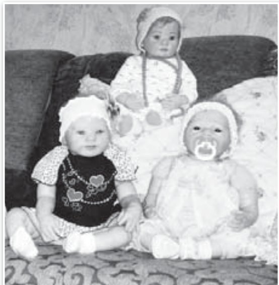
Материалы подготовила Марина МАЗУРЕНКО