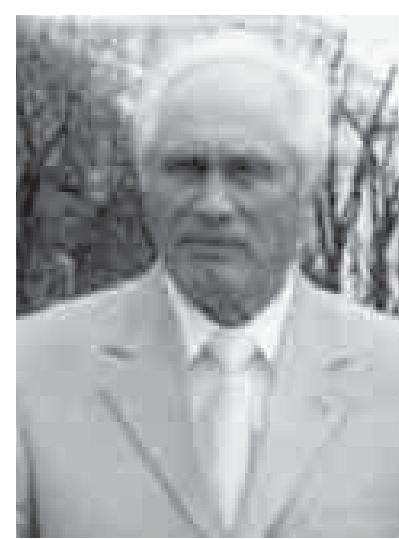
КПСС, затем в 1988 году – в управление «Каббалклавснаб»

В 1980 году после окончания учёбы в Ростовской ВПШ был избран секретарём парткома завода НЗПП, а в 1984 г. переведён в аппарат Нальчикского горкома