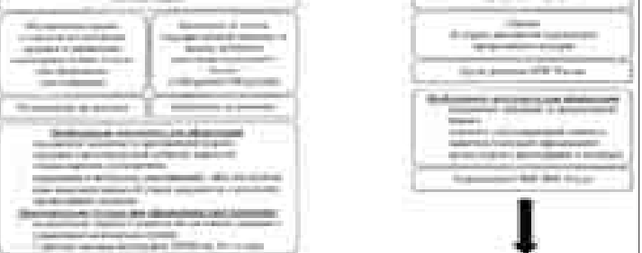
БЛОК-СХЕМА пошаговых действий граждан Российской Федерации по восстановлению утраченного удостоверения на право управления маломерным судом/судового билета