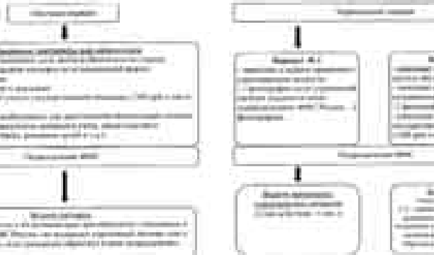
Приложение № 2 к Методическим рекомендациям по оказанию помощи в оформлении правоустанывливающих и других утраченных документов пострадавшим в чрезвычайных ситуациях