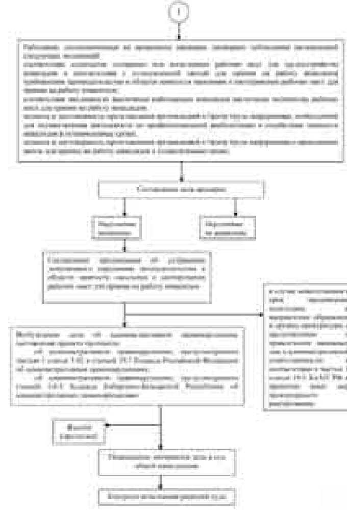
Утвержден приказом Министерства труда, занятости и социальной защиты Кабардино-Балкарской Республики от 27 октября 2015 года № 331-П