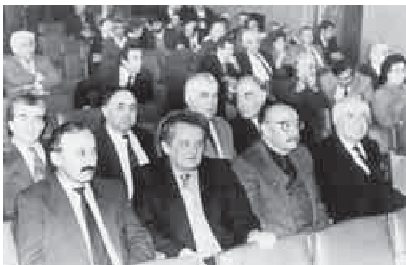
Суратда Гургуланы Элдар бла жазыучулары кьаууму КъМССР-ни жазыучуларыны X съездинде.