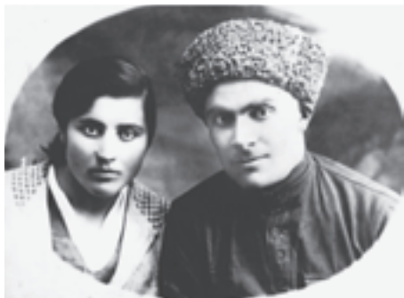
Атик бла Атик уруш 70 жылда

Мени анама Уллу Ата журт уруш 70 жыл баргъанды. Анча жылны ичинде къолунда тёрт сабий бла къалгъан 27-жыллыкъ Анам Аба (жазылгъаны – Абат, аны атын уллу харф бла жазгъанымда да барды магъана – аны кеси кирик сёзюне табылгъан, баш иесине кертилей къалгъан, урушха кете туруп баш иеси этген аманатланы, тамбла келип къалса, не бетден тю-