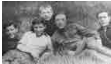
Будайланы Азрет типографияны ишчилери бла

Бир кесекеден Нальчикде Азретге тюбеп хапарлашханыбызда, ол поэма-сын элде сахнагъа чыгъарып кёргюзт-