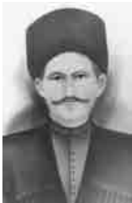
Будайланы Азретни атасы Кичибатыр.

Дугьумлача кёзлери Бек сьюдюрген сёзлери. Къаракъаши, акъмангылай, Айтханынгы ангылай.