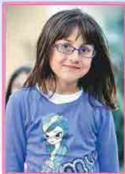
АНИЯ Шагъӕш – илъэси 10 и ныбжьщ. «5» защӕкӕ йоджэ.

Цыкӕлхӕ, фӕ фоцӕ адыгӕхэр Тыркум, Иорданием, Сирием, Израилым, нӕгъуэцӕ къӕралхӕми зрыщӕпсӕум.