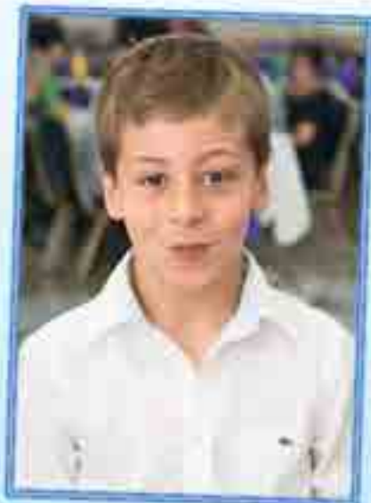
НЭПСО Нарт – илъэс 12 и ныбжьщ. Дзюдо спорт лӕужыгъуэмкӕ Израиль псом щекӕуӕкӕ зӕхъзӕхуӕм и финал ныкӕуӕм япӕ увыпӕр къыщихъӕхуӕц.