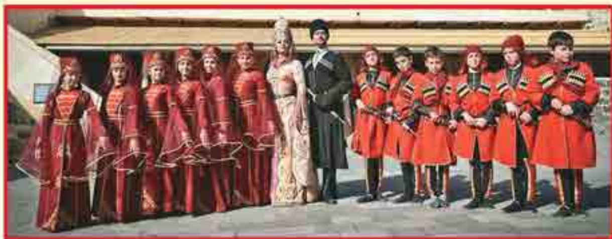
Кфар-Камэ къуажэм и «Типсэ» къэфаклуз гупырщ.