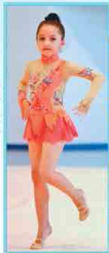
ХЪЫБИЙ Даринэ Тэрч къалэ дэт Лицей 1-нэм фы дыдэу щоджэ, уэрэд дахэу жыланым, усэ къеджэным дехъэх, фащэр флэфлти, къафэу зригъэсащ.