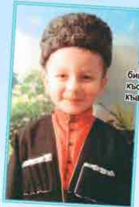
ДУМЭН Ислъам Къармэхъэблэ сабий садым и гэсэнщ, усэ гъхуэуа къоджэф, хъуэхъу куад өщлэ, адыгэ къафэм дехъэх.