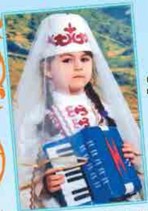
ДЖЫРАНДОКЪУЭ Алинэ Тэрч «Таурыхъ» сабий садым и гэсэнщ, сурат щыным дехъэх, уэрэд жиғану, къафэну флэфлщ, гъхуауэ усэ къоджэ.