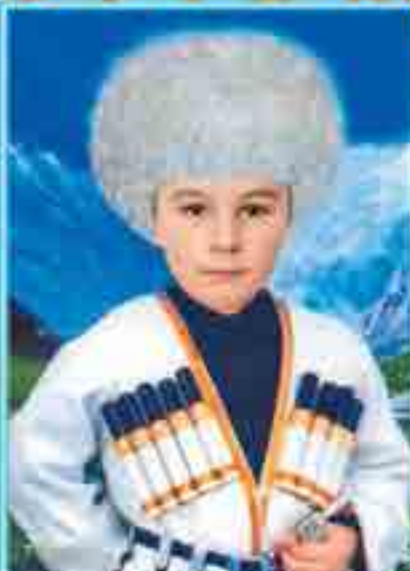
ІЗБЫДЭ Къантэмыр Къармэхъэблэ сабий садым и гэсэнщ, адыгэ фащэр фыуэ ельагъу, дахэу къофэ.