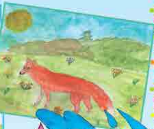
НЭХУЦ Арианэ Бахъсэн 3-нэ школым фы дьдэу щоджэ, 3-нэ классц, сурат ищыну флэфц.