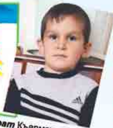
ГУГЪУЭТ Мурат Къармэхъэблэ 3-нэ курыт школым хэт сабий садым и гэсэнц, сурат щыным дехьэх.