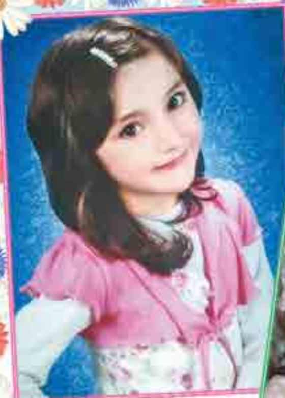
Мен Османланы Жаннетама.