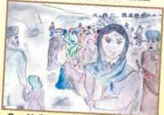
Сур. Улбашланы А., Экинчи Чөгем.