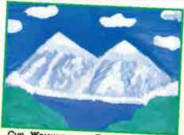
Сур. Жаникаланы Д., Экинчи Чөгем.