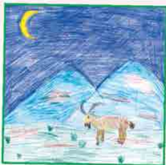
Сур. Кьвазакьланы Ф., 16-чи школ.