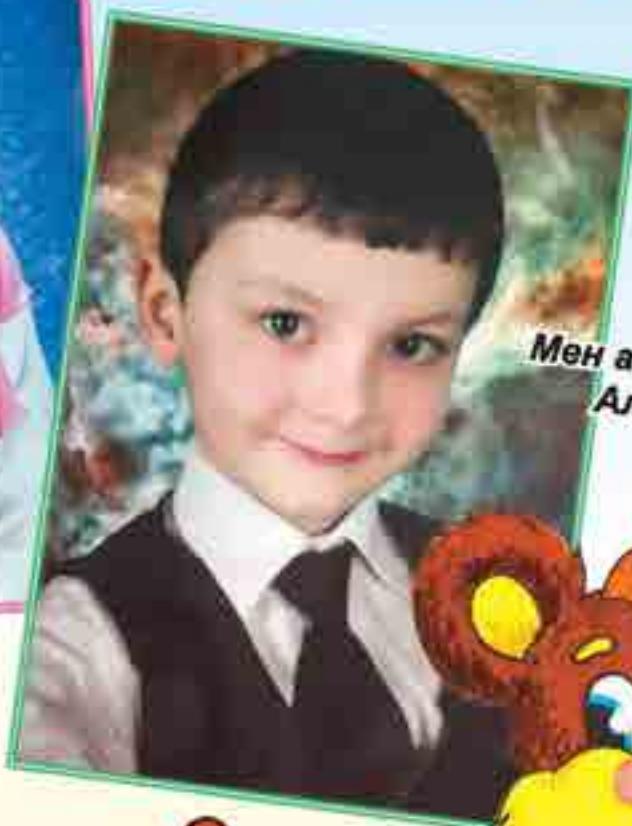
Мен а Османланы Алиханма.