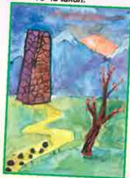
Жабелланы Милана, 18-чи школ.