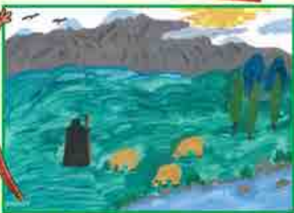
Сур. Атакуланы А., 18-чи школ.