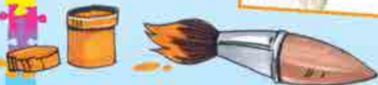
Сур. Гаджикурбанланы Илхамныдыла, 1-чи школ, Экинчи Чегем.