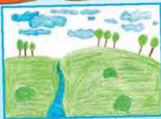
Сур. Гудуланы А., 18-чи школ, Нальник ш.

Лейтенант ол затны терк окъуна штабха эшитдирди. Танг атаргъа фашист танкла, отда жанып, кеслери кюйдюрген мамыр элни кесеу башларына кьошулдула. Лейтенант кесине берилген буйрукъну кереклисича толтурду.