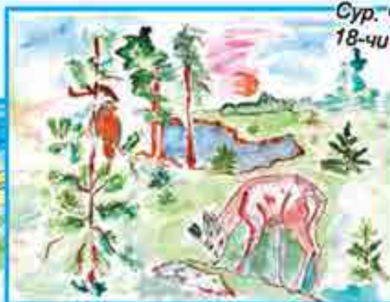
Сур. Чочайланы И., 18-чи школ, Нальник ш.