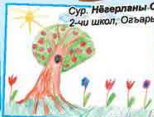
Сур. Нёгерланы С., 2-чи школ, Огъары Малкъар.