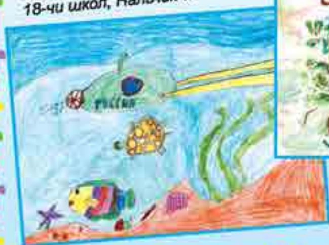
Сур. Дузулюбзова М., 18-чи школ, Нальник ш.

– Къалай келдинг, балам? – дер, – Атлар туюл бюгюн жер. – Мен а колюрме анга: – Тейри кылычха къара!