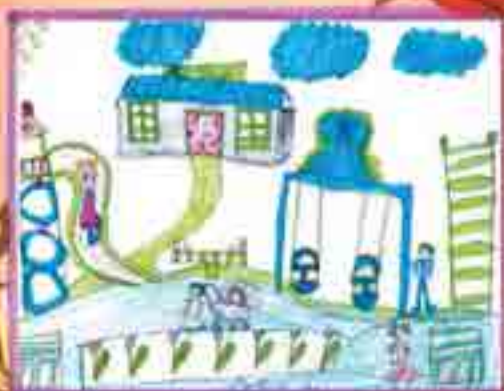
Сур. Нбгерланы Салиманыды, Огъары Малкъар, 2-чи школ.

Башындан энишге: 1. Дева. 2.Венера. 3.Полярная звезда. 5.Созвездие Льва. 6.Меркурий. 10. Козерог. 13.Дева. 14.Стожары. 16. Овен.