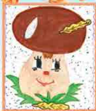
Сур. Занкишиланы Жамиляныдыла