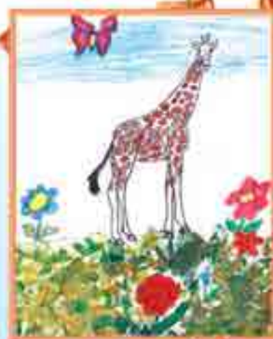
Сур. Холамханланы Алинаныдыла