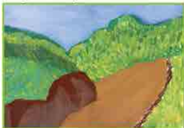
Сур. Чаналаны Аминатныды, Огъары Малкъар