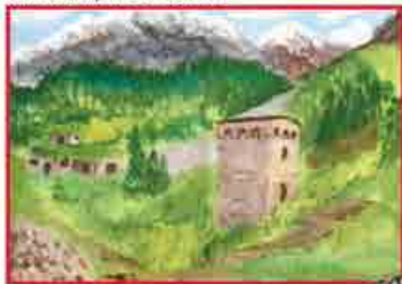
Сур. Байсолтанланы Рамилниди, Нальчик, 18-чи школ.