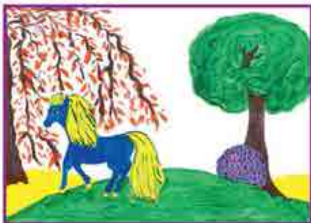
Сур. Забакъланы Лейляныды, Огъары Малкъар