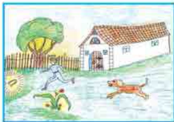
Сур. Занибекланы Альбинаныды, Огъары Малкъар.