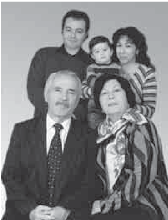
Мысостышхуэ Пщызэбийрэ ЖѳакІэмыхѳу КІунэрэ я бынхэр я гѳусэу

кѳохуулэ. Апхуэдэу щытми, актрисэм кѳызэрыхигѳэщымкІэ, трагедием, драмэм кѳыщигѳэщІ образхэр езым и хѳэл-щэным, дуней лѳагѳукІэм нэхъ пэгъунэгъуц, гѳащІэм куууэ хэзыщІыкІ, зи акѳылыр жан, цІыхухэм пщІэ зыхуащІ бзылѳхугѳэм и образыр и псэм нэхъ дохѳэ.