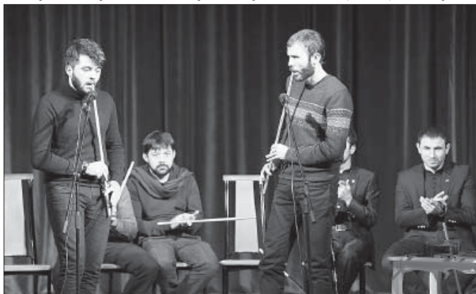
Фото и видео на сайте ( http://www.smkbr.net/video ) Татьяны Свириденко.