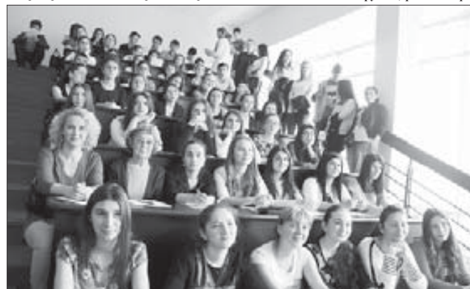
Г. Урсуова, фото автора.