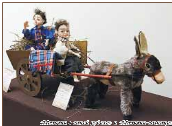
«Мальчик в синей рубашке» и «Мальчик-возница»