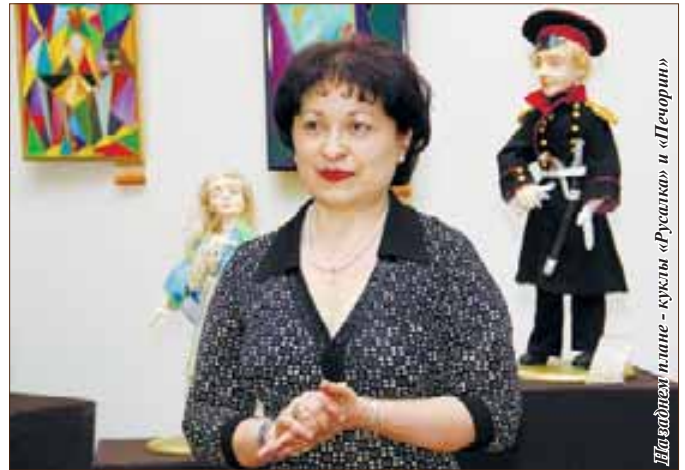
Шоколадные пирожки - куклы «Русалка» и «Печорин»

5 июня в Государственном Национальном музее КБР открылась выставка Жанны Хурановой