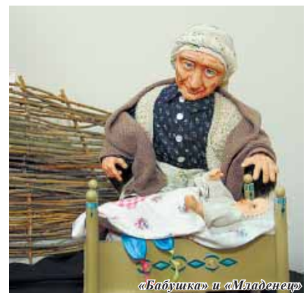
«Бабушка» и «Младенец»