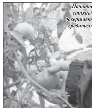
Начиное стихией довершают вредители

я просто подняла и привязала кусты, чтобы хоть то, то осталось, не сгнило: они поломанные, уже не питаются от корня. Полностью все сносить надо и делать по новой. Это ужас просто. Ущерб огромный. А нам даже за прошлый год субсидии, положенные за теплицы, только наполовину отдали... Как я буду восстанавливать, если мне никто не поможет? Если нам не посочувствует и не поможет руководство республики, не знаем, что делать. Мы не особо верим, но все же надеемся. Сегодня ходила администрация, в какие-то дворы заходили, записи какие-то делали, но ко мне не зашли».