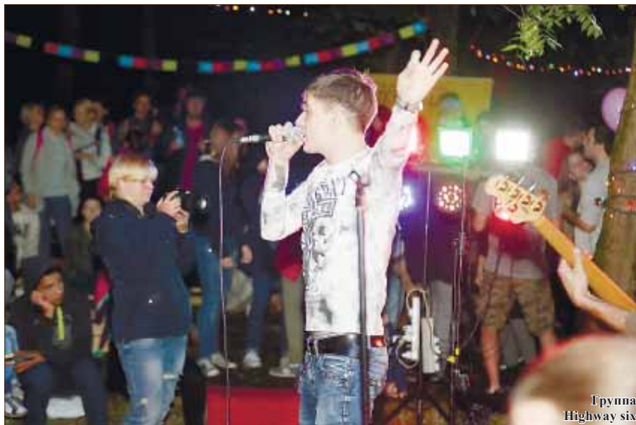
Группа Highway six