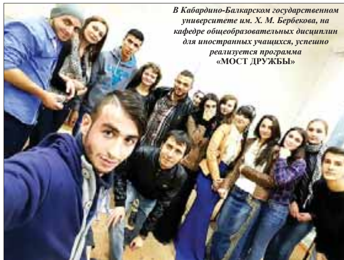
В Кабардино-Балкарском государственном университете им. Х. М. Бербекова, на кафедре общеобразовательных дисциплин для иностранных учащихся, успешно реализуется программа «МОСТ ДРУЖБЫ»

Проект «Мост дружбы» (Bridge of Friendship) предназначен для помощи иностранным студентам в социально-культурной адаптации с привлечением местных студентов-тьюторов.