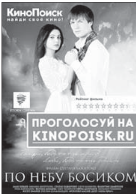
Постер фильма на сайте «КиноПоиск»; рейтинг картины на ресурсе на данный момент составляет 8,5.

Территориальное управление Федерального агентства по управлению государственным имуществом в КБР (далее – Организатор торгов) сообщает о проведении торгов по реализации арестованного УФССП по КБР имущества, принадлежащего: