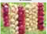
Сохан да, турмача, С витаминден байды. Аскорбин кислотаны ѐлѐчми бла ол альпесинни окуна озады! Аны ийиси бурунну бла тамакъны микробладан къорулайды. Ол себедден грипп, кесекле артыкъда бек жайылган кезиуде соханын шорлагъа бла салатха къошуу бла чекленмегиз, ингалицияда да этигиз.