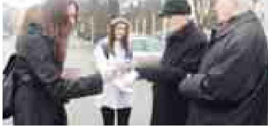
Нальчикде генерал Трошевнын атын жюрюткен 11-чи номерли орта школну тогузунчу класкыны окуучулары эдиле.