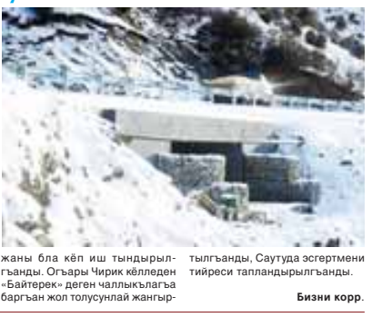
жаны бла кѣп иш тындырылганды. Огъары Чирик кѣлден «Байтерек» деген чалыклагъа баргъан жол толуспалы жангыр.