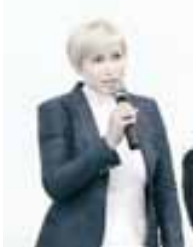
улуу жетишимле болдуруларын тежейме.

Нальчикде «Гладиатор» спорт комплексде тунене, бокадан дуняны чемпиону Наталья Рагозинаны сауыгаларына Россейни аскер кючлерини биринчилиги башланганды. Анга кыралны 30 регионундан 1999-2000 эм 2001-2002 жыллада тугъан юч жоуден аслам жаш спортчу кытышды.