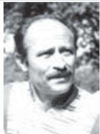
Жел булутту гыркык буруп, Толкунулата, тенгиз уруп...