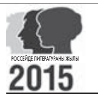
РОССЕДЕ ЛИТЕРАТУРАНЫ ЖЫЛЫ