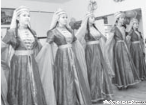
«Элбрус» ансамбльни кыаууу.