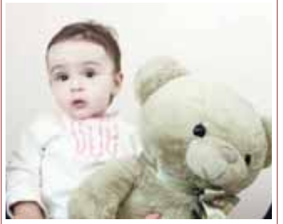
Маъкъланы Салима Бабугентде жашайды. Анга 1 жыл бля 2 ай болады.