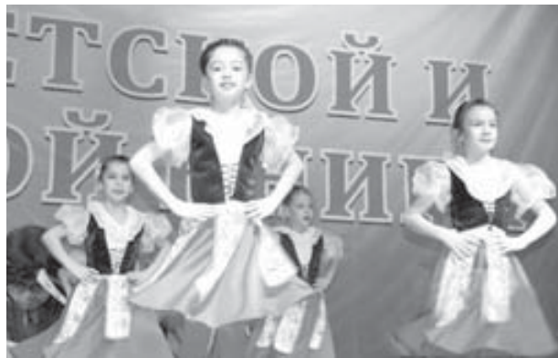
«Ровесницы» сабий тепсеу кѳаууу.

Сора республикада жылны ичинде бардырылган «Нам этот мир завещано беречь!», «Радостное чтение», «Книга, которая помогла мне», «Папа, прочти мне!» деген эришулени номинацияларында хорлаганланы сыйлы грамотала бла саугалагандыла. Ачылуу церемония жаш кѳарауучулары кѳууандыргган фейерверкле бла