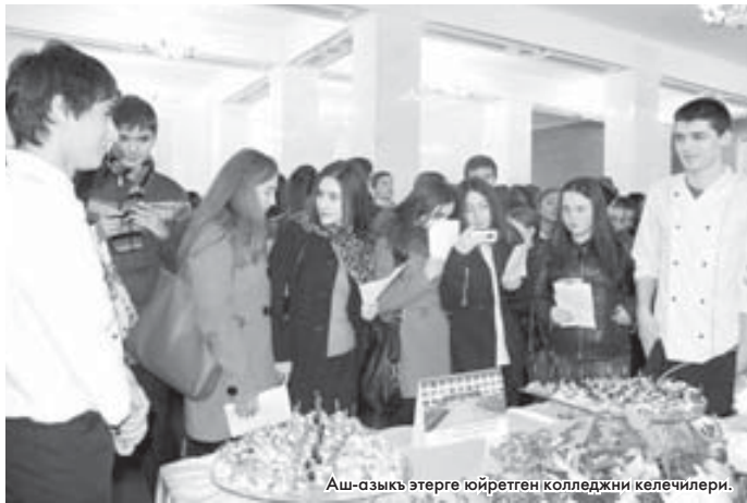
Аш-азыкъ этерге юйретген колледжни келечилери.