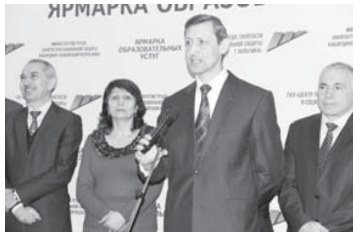
Баразбийланы Муслим сёлешеди.

Усталыгын жюреги тартып, билим сайлагъан адам жетишимли болмай къалмайды. Алай кепле вузда окъуй