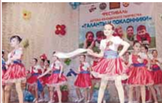
Аллашкылар жаш тылоле аныктыла.