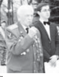
«Орленок» къауымга алыу.

жолгъа атланганды эм кеси да эки къауымгъа юлешинип этгенди. Биринчиси, Брест къаладан чыгып, Москвагъа, андан Крымгъа ѳтеркиди, ызы бла уа Шимал Кавказы республикаларында болуп, Армениягъа да барлыкъды. Экинчи къауым, къыралны Север жанында субектлеринде болуп, Къазахстангъа къайтырыкъды. 28-чи майда Чеккинни конюнде - ала Москвада тюбеширдиле.