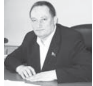
Урулгун сепген эдик. Хар гектардан 40-шар центнер жыйганбыз.

Тыш къыралла Россейге санкцияла кийиргенлери эл мюлке урунганлагъа ауур тийгенди. Фермерлеге, жерчилик бла кѳрешенгеге кредитле алыштыра тошеди. Бусагъатда уа къыраллыбызда, аны тийерсинде бола тургъан ишле бла байламлы ол къыйын болгъанды.