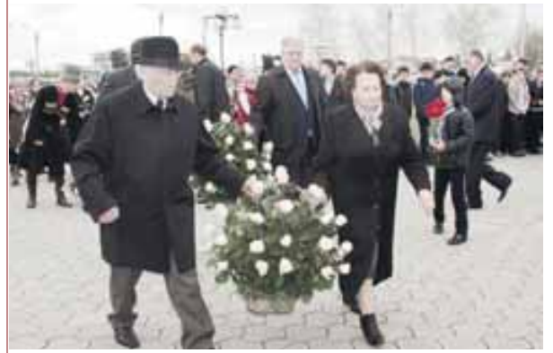
Уллу Мартыновкага тебеген эдиле, ма бюгоню жашлача, ариула эмда жигтле. Кёллери артка къайтмагандыла. 115-чи