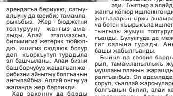
Бетни басмагыз ТИКАЛАНЫ Фатима хазырлаганды.