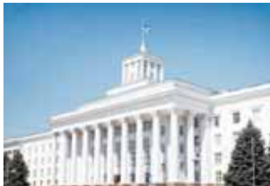
Тынгылы тинтирге керек болгъан жумушлары уа бир ыйкыны ичинде тамамларгъа белгиленгенди. Жылны башындан бери республиканы оюучусуна кеслерини