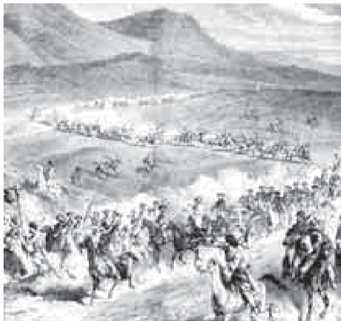
Черкес оскерле похода. 1838 ж. Художник белгисизди.

- Да сора бююнлюкте ол тема толусунай тинтилгенди, кемчимликле жокъдула