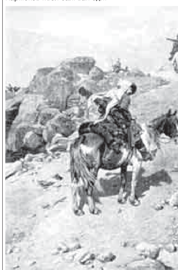
Черкесли атыла таулада. Суратны Вируц-Ковалевский Альфред ишлегенди. 1885 ж.

Сёзге, 21-чи май Эсгеруно кюнюча, ол документге кере тохташдыргъанды. Бу бушуулу кюн адыг диаспора болгъан битеу кыраллада да белгилениди, мен алагъа кесим да кеп кере кыатышанма. Ол кюн бир тюрлю радикал чакъырыула этилмейдиле, кыужур сёзле айтылмайдыла, бир адам да терленмейди.