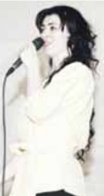
Башир бек кылендирген эдиле.

Конкурсу ахыры да эки кезуенден кыурулган эди. «Визитный карточкада» ага кыатышханлы юйретуу ишде кеслерини энци амалларны кыргюзюрге керек эдиле. Аланы хар бири да асыры игден, жюрини