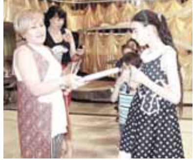
членлери да жарык тюеп, шинтиклеге олтуртхандыла. Нальчикде 1-чи номерли художестволу школну окуучулары уа бир-бирлерини бетлеринде Россейни, Кыбарты-Малкыарны да байракларыны суратлары ишленгенди.