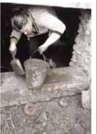
биополе-булгъана, башы-агъгы кёрюнемей, келе... Ол келтиргенде кир-кипчик жокъ. Ала да адамгъа тийип, бирлени жаралы этмегенди да насынды,- дейди бизге Гюла бахчада.

КъМР-ни Башчысыны Администрациясында кече, кюн да улутхачылыкгъа къажау телефон ыз ишлейди: 8(8662) 40-89-70, 40-34-32.