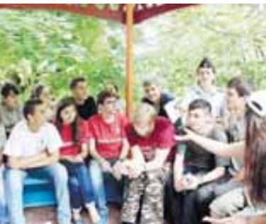
МВД-ны КМР-де пресс-службасы.

тири кыатышханлагга уа КМР-де МВД-ны атындан ырызлыккы кыагытла берилгенди. Келир заманда тамамлангышы ишлени юсюнден айтканда уа, биринчи класска бардыккыла жоллада кеслерин кыалай жюрюкторге кереклигин ангылатыла баш магына берилиши чертлгенди.