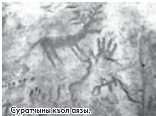
Суратчыны къол аязы.

Байрым күн Тырнауудан татлы тенгим Хапаланы Назир селешеди. Таулары иги билген, аланы ата юйюча сыйген жашды. Кеси уа чынтыкъаячыды десек да, ётюрюк болмаз. Жыл саны юч жыйырма жылдан ат-