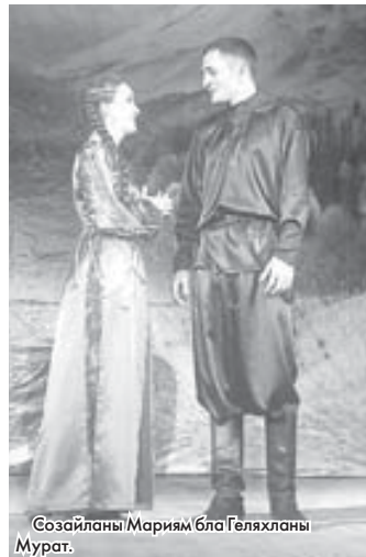
Созайланы Мариям бла Геляхланы Мурат.

Шауканы Сарбашланы Аскер ойнайды. Уллубыдыр, къызгъанч жаш Тауланнга ётюрюк шухё болгъанын, тап туюшгенлей, сюйген кызын, алтынны да къолгга этеригин толу ачыкълагъанды