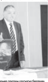
Беспон Гулажионы көпелени эмда мермер плитоны сауыгыла бергенди.

«Биз мында болган бир неча кюнню ичинде жалаңда отурлулук, жылыу, билекли сезгенле турубиз. Кызайи барсакъ, къыяда айлансакъ да, бизге тюз къыярашарынакъ болардыла. Ол уа бек багылы шарды. Мен унаиверситетде окуган зам-