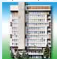
360000, Нальчик шахар, Ленин атлы проспект, 5