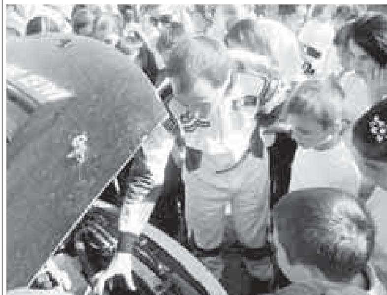
Спорт машиналагъа сабийлени сейирлери уллу эди.

«Кавказавтосити» хайырланлыгы берилсе, бюгюнлюкде шахарны орамларында кеслерини, башхаланы жашауларына да кюркюу салып чаришле кырагъан жаш адамлагъа ол суйген оюнларын кишиге