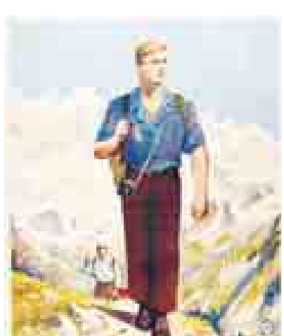
ПУТЕШЕСТВИЕ ПО ГОРАМ КАВКАЗА!

Ол заманланы реклама плакатларында бла брошюраларында жалаанда Москваны бла Ленинградны суратларын кёрлөп коймайса. Башда сагынылган