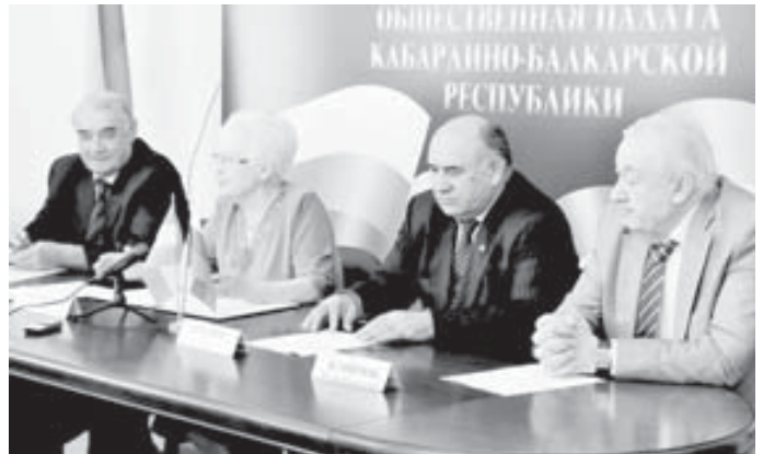
КъМР-ни Жамауат палатасыны таматасына тийишли кѣргенди.

«Бир жылны ичинде законланы уллу къауумун сюзгенбиз, битеу комиссияла бла комитетле да иги ишлегенди. Баш жетишмилерибизден бирине уа Бизнесни институтун жабаргъа къоймагъаныбызны санаргъа боллукъду. КъМР-ни Жамауат палатасыны къыралда магъанасы ѳсгенди. Мындан ары да республикада жашагъанланы сейирлерин къоруулау жаны бла къыйын эм жууаплы ишни бийик даражада толтуруусуз деп ийнама», - дегенди.