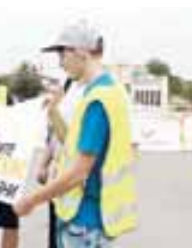
унутмазга кереклисин эсертгендиле, эчкин кьорууларга атланы кийилге улу кльонлук этерге жарамалыгына тошондюрген...