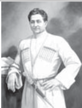
Улут коллегияны члени болуп ишленгенди. Аны бля бирге ара басманы коллегиясыны куурамына да киргенди. Адыгены Москвада келечилигине председателилык да эткенди. ВЦИК-нин коллегияны башчылыгына киргенди. Районларында маданият, экономика эмд политика ишлене тамамлауга ююш куошкандын.