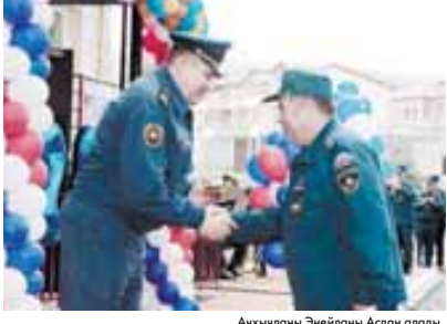
Ачыкъланы Энейланы Аслан алады.

юрюле участкала бериге деп буйрыкъ чыгаргъанды. Кертиди, республикада сууу, газы, элекотроичеко да болгъан жерле жокуну орундадыла, болсада ол жаны бла да амалла излендиле. Ол кюн окуна ачыкъла къоллу болганла, мекамны ичине кирип, фатарларын кёргендиле. ХОПАЛАНЫ Марзият. Суратланы автор алгъанды.