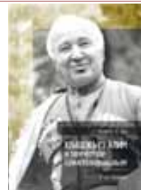
токсынынчы жылларындагы лирикасыны темалары соююдеди.

«Биринчи дуния уруш халкыны эсинде эм суратлау литературада» - адабиятта бу кезиуу кыалай кергозюлгенини юсюнденди. Экинчи башында - «А.Кешоковну» Сломанная подкова» романында мифиу суратлау функциясы» - автор чыгармасында таурухланы башха-башха вариантларын кыалай хайырлангананы тинтиу этиледи. Ючюнчюсюнде - «А. Кешоковну чыгармачылыгында дунияны эм адамны концепциясы» - жазычуу жыйырмачны ёмюрню