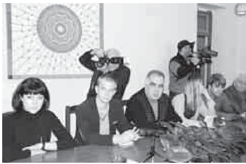
эмда чыгъармачылык хунерлерин кѳрѳрге себегдиле. «Архыз 24» программаларын россейли эм «Триколор ТВ», «НТВ+» эмда «Ростелеком» цифровый телевиденияны операторлары кѳргѳзтедиле.