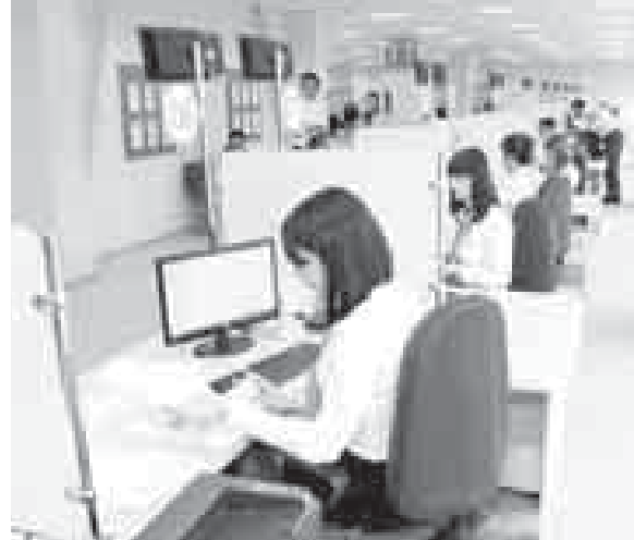
районлада да къураллыкдыла ала. Ол а анда жашагъанлагъа иги себеплик этериги баямды. МФЦ-ны адамлары дагъыда республиканы битеу элдеринде жер-жерли администрациялада ишледиле. Сагъынылган жумушланы Нальчикге неда район аралагъа барып айланмай, алагъа тубеп, алай тамамларгъа болурукду.

Къабарты-Малкъарны къырал эм муниципал жумушланы тамамлау жаны бла кѳп функциялы арасы (МФЦ) хар кюн сайын беш жюз чакълы адамны жумушларын жалчытады. Бу учреждение ишлеп башлагъанлы тѳрт жыл болады. Анда хайырланган «бир терезе» деген амал адамлагъа, тюрло-тюрлю ведомстволаргъа барып айланмай, керек документни неда башха жумушну мында, бир жерде, хакъсыз тамамларгъа онг бередиди. Нальчик шахарны администрациясы берген 59 жумушла да ол тизмеге киредиле, деп билдиредиле андан. Ол санда «къурулушну бардырыргъа эркинлик беру», «жерге къурулуш планы беру», «сабий садиклеге заявлениланы алыу» эм башхала. Дагъыда МФЦ-да онтѳрт тюрлю справкала бериледиле. Бу тизмеге юйорно къауумуну, ишчи стажы болгъаныны, анга шагъат китапчыкны юсюнден справкала да киредиле.