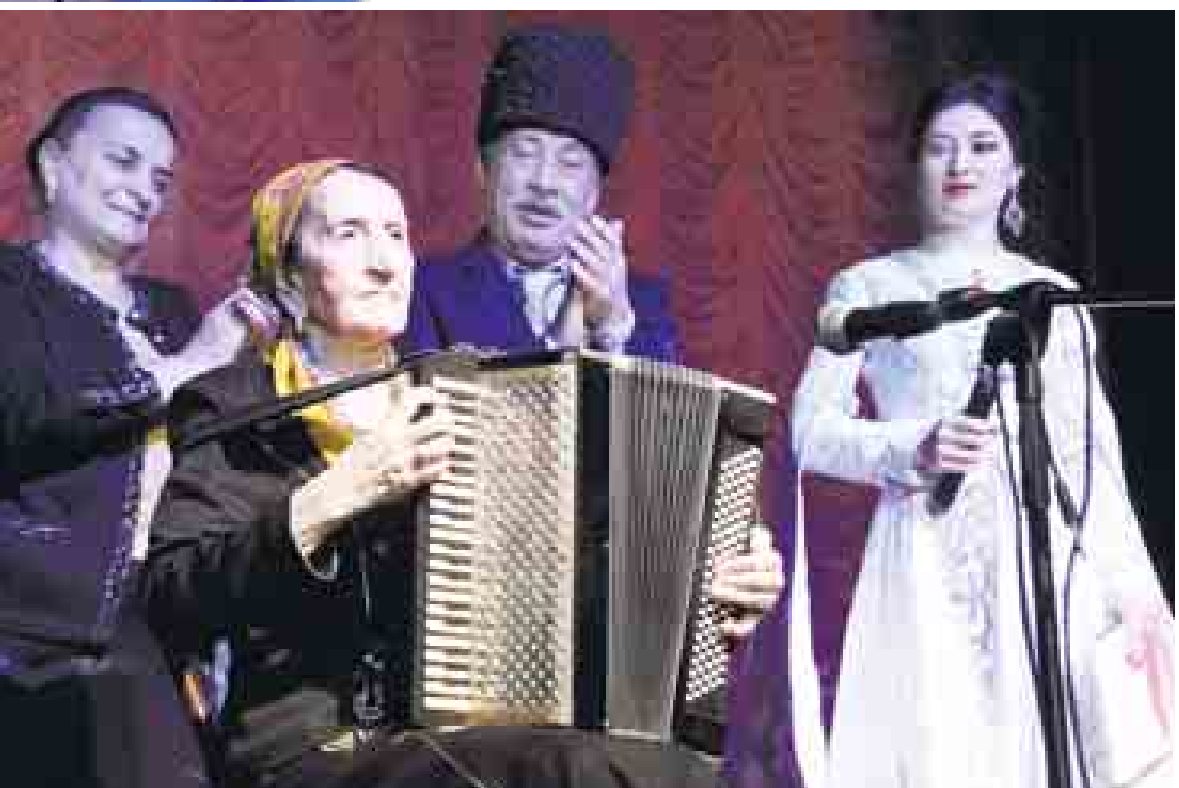
Темирканов (Урван район) эм башхала эшитиргендиле.