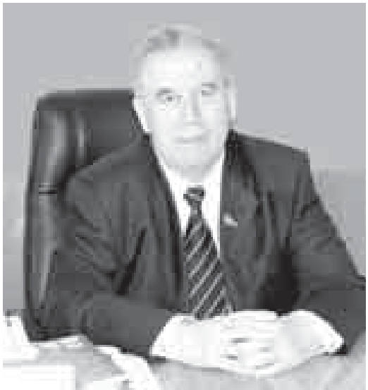
- Алла тюрлениуле болмаймыдыла да шендю?

аздан айнытуу башланган эди. Шендю уа болум башхады. Экономика-бызда осал тюрлениуеден кытулурча, производства, башха сфералада да эрттеден бери жыйылып турган кемчиликлени кетерирге керекди. Ахча-кредит, налог, тариф политикаканы тюрлендирмей, билим берюде, культурада, саулык саклауда, илмуда да тийишли оную этмей, ишни кыолгга алмай боллук туююлду.