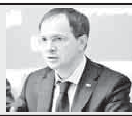
«Гроссмейстер, сейир-тамаша! Мен хорлатханыма энтта бир кере женгдиремей!».

РФ-ни культура министри Владимир Мединский МГИМО-да дипломат боллукъ жаш адамлага лекция окъурганды эмда Октябрь революцияны бла Граждан урушну юслеринден бюр бюр хапарла бош тауухла болгъанларын ачыкъларганды.