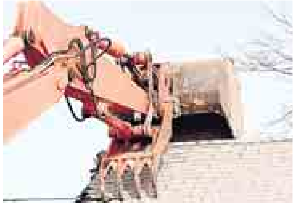
ючюн сюд органлага 117 исковой заявление берилгенди. Аладан бюгюнюкде 73 къабыл этилгенди. Ол санда 28 ишни юсю бла тийишли мадарла толтурулгандыла.

Быйыл Нальчик шахар округну администрациясы, федерал надзор структурала эм МВД-ны управлениасы бла бирге жашау журтла сферада бузукълукла этилгени ючюн 192 административ иш ачандыла. Ол санда 123 - муниципал жерлени эркинликсиз бийлегенлери ючюн, 25 - эркинликсиз къурулуш бардырылганы эмда 44 - кеп фатарлы юйледе отуулары планировкасы тюрлендилгени ючюн, деп билдирдиле шахарны администрациясыны пресс-службасында.