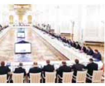
КЪМР-ни Башчысыны бла Правительствоуну пресс-службасы.

граммаларына кёре 90100 адам окъуйду, сабий садлагада къошакъ халда 8,5 минден артыкъ жер къураулыганды. Энди ала бла жыл сапаны 3-ден 7-ге жеткенде барысы да жалчтылынылды. «Доступная среда» къырал программаны чеклеринде сакъат эмда къынуу сабийлерге билим алырга онгла къураулыганды. Эки жылны ичинде ма ол мадарлагъа жюз миллион сомдан артыкъ бөлүнгенди.