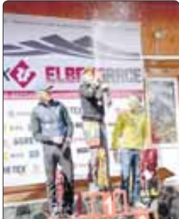
Иуашьмамуз лъапэ шыфрэнкэц Red Fox Elbrus Race VIII дунейсо фестиуалыр. Ар теухуау шытац Теклуынэгъ Иныр ильэс 71-рэ зырыркыт.