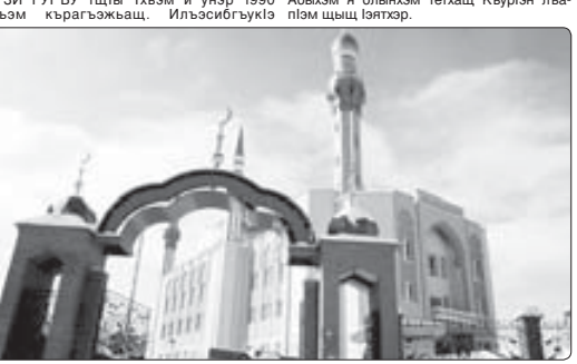
Напэкууэуэр зыгьэзэсэр ШыЛОКЬУЭ Лусанэц.

Тэтрэстаным хьыкэ Альметьвэск кьэалэм дэт мэжджытхуэцхэм Галле-тэкторхэр. Мэжджытм и нэмэз шьыпцэ пэшэ-шухум цыхуэ 1200-рэ зыцэ шлохуэ. Кьышэнышэуау, абы хэцц конференцэ залхар, диним ехьлэлэ лүуэхуэцхэр шь-зэрпикисэ нэгьуэцц пэщэ зьыжэан. Абычым а бьлэчым тэцхэц Кьурэн пэ-плэм шьыцэ йтэцэр.